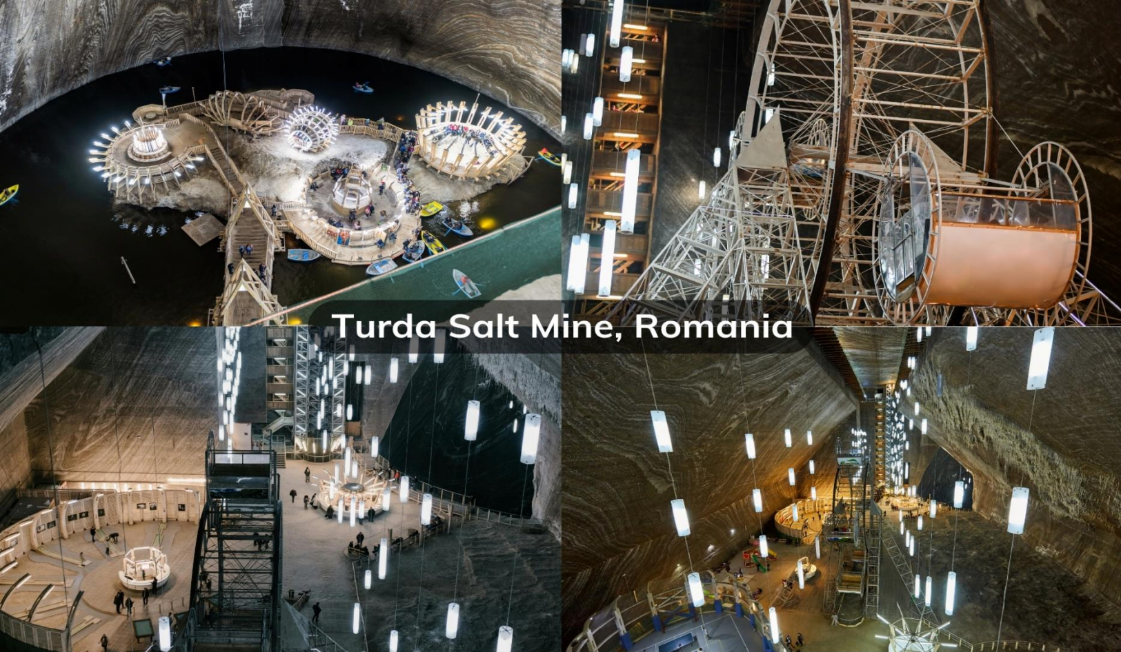
Turda Salt Mine, Romania