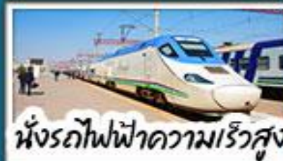
นั่งรถไฟฟ้าความเร็วสูง