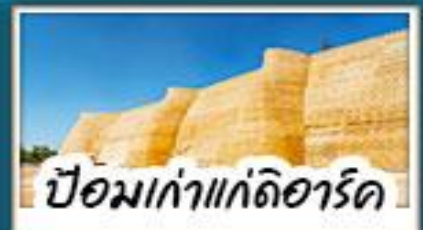
ป้อมเก่าแกด์ลีอาร์ด