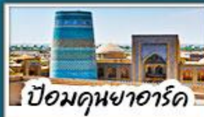
ป้อมดุฆาอาร์ด