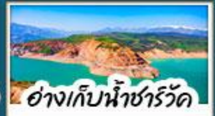
อ่างเก็บน้ำซาร์วัต