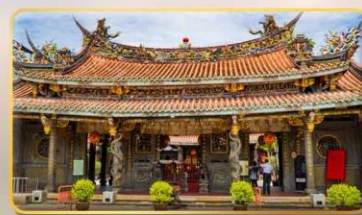
วัดต้าหลงตงเป่าอัน