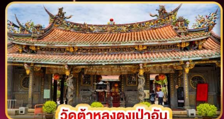
วัดต้าหลงตงเปาอัน