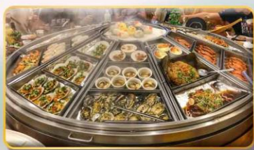
หม้อนึ่งจักรพรรดิ