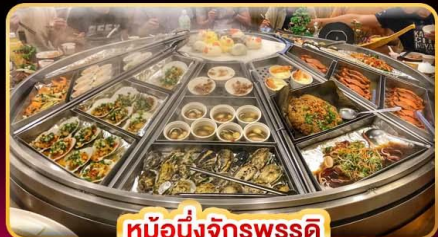
หม้อหนึ่งจักรพรรดิ

แพ็คเกจรวมตั๋วเครื่องบิน บินคุ้ม เที่ยวครบ เช็คนจุดไฮไลท์