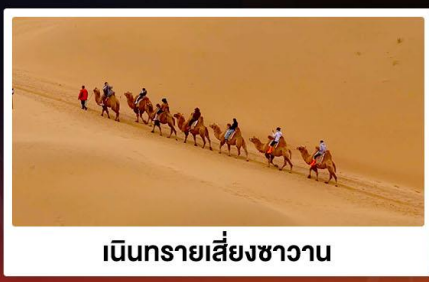
เป็นทรายเสียงขวาน