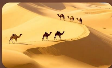
เนินทรายสี่งชวาน