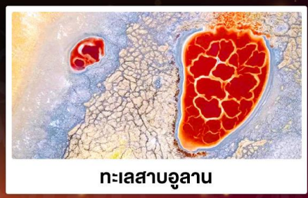
ทะเลสาบอูลาน

🏠 พักโรงแรมพื้นเมือง แบบกันสมัย มีห้องน้ำในตัว