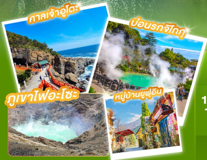
ศาลเจ้าอุโตะ