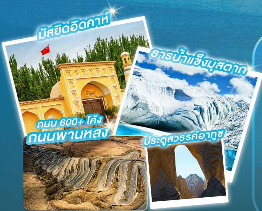
มัสยิดอิดคาคห์