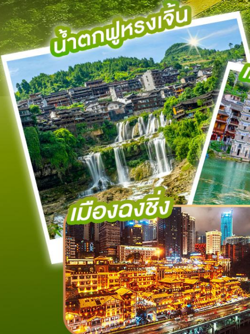
น้ำตกฟูหรงเจิ้น